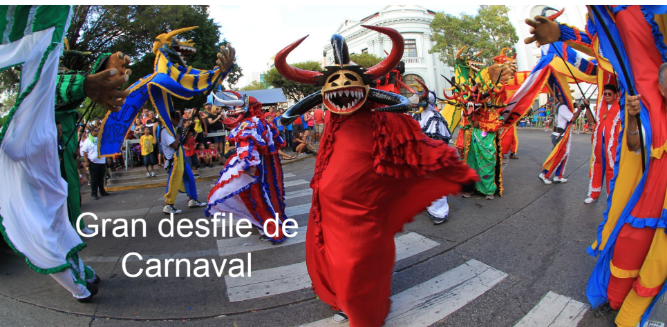
Gran desfile de Carnaval