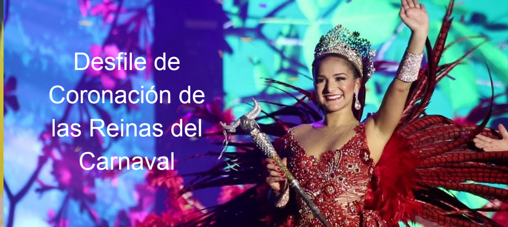
Desfile de Coronación de las Reinas del Carnaval