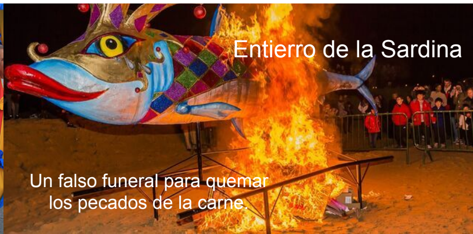
Entierro de la Sardina